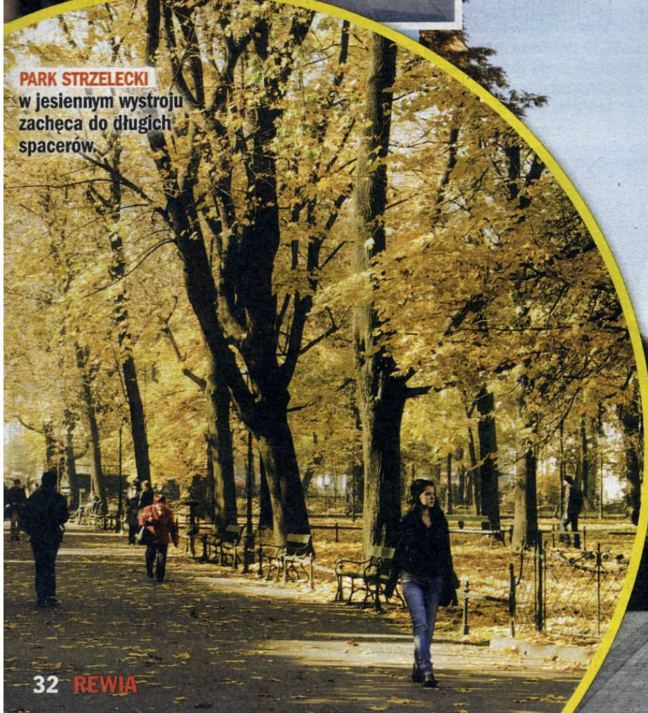
PARK STRZELECKI w jesiennym wystroju zachęca do długich spacerów.