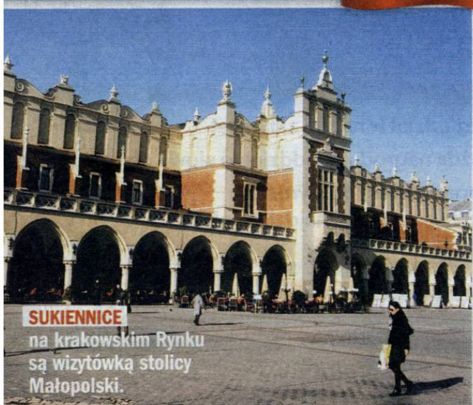
SUKIENNICE na krakowskim Rynku są wizytówką stolicy Małopolski.