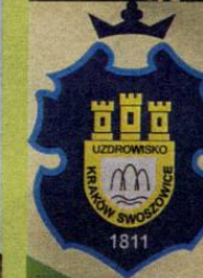
Zabiegi w uzdrowisku Kraków Swoszowice

► Profil leczniczy uzdrowiska Swoszowice obejmuje schorzenia reumatologiczne, takie jak choroby zwyrodnieniowe stawów i kręgosłupa, schorzenia narządów ruchu (pourazowe i pooperacyjne) i schorzenia dermatologiczne.