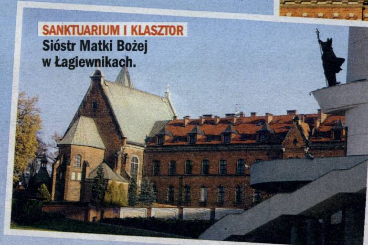
SANKTUARIUM I KLASZTOR Sióstr Matki Bożej w Łagiewnikach.