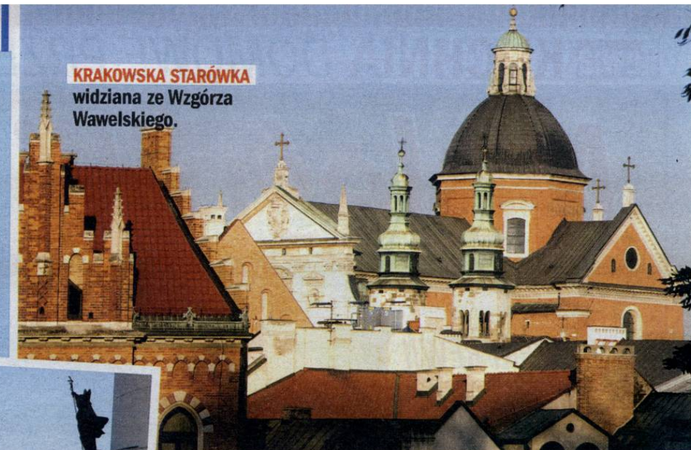
KRAKOWSKA STARÓWKA widziana ze Wzgórza Wawelskiego.

Dzisiaj Swoszowice to krakowska dzielnica z dawną, sielankową atmosferą. Obiekty uzdrowskie leżą na terenie pięknego Parku Zdrojowego. Mieszczą się tu Stare i Nowe Łazienki, pawilony Parkowy i Słońce, willa Szwajcarka. Jesienią jest tu szczególnie nastrojowo.