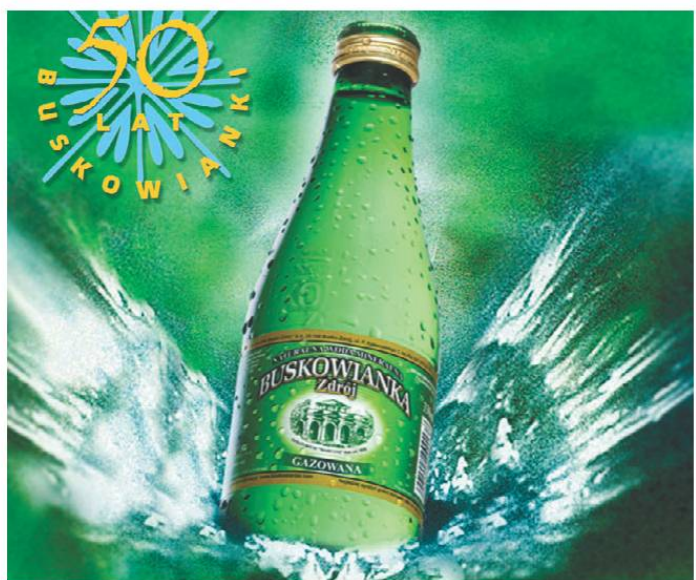
Buskowianka to jedna z najlepiej rozpoznawalnych wód mineralnych w naszym regionie.