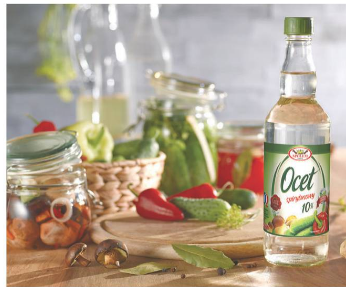
Wytwórcza Spółdzielnia Pracy Społem w Kielcach produkuje tradycyjny Ocet Spirytusowy 10 procent już od 80 lat.